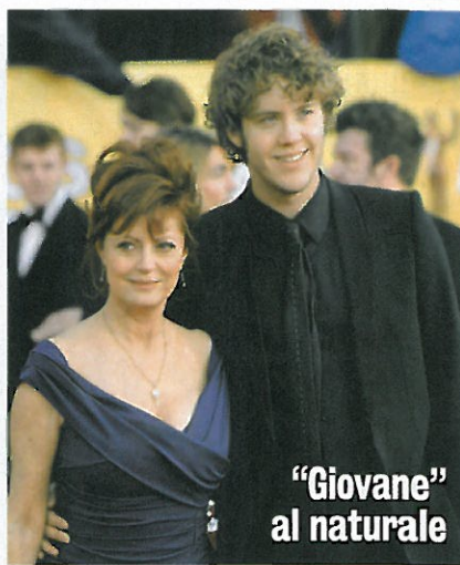
"Giovane" al naturale

C ambiamenti fisici, vampate, sbalzi di umore, problematiche psicologiche. Su molte donne la menopausa ha non pochi effetti spiacevoli, e tra questi alcuni localizzati proprio nella zona genitale: secchezza delle mucose, dolore durante i rapporti, lieve incontinenza, rilassamento dei tessuti, bruciore, prurito. Cominciamo col dire che la menopausa non è di per sé una malattia, ma il frutto del fisiologico calo della sintesi degli ormoni sessuali femminili (estrogeni), calo che dipende dall'invecchiamento. Ecco perché non si può parlare di cure per la menopausa, ma di cure per combatterne gli effetti indesiderati. Ben conosciuta è la terapia ormonale sostitutiva, che prevede l'assunzione di un estrogeno a basso dosaggio (ma